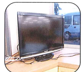
ビデオカメラ・MD ラジカセ・地デジ対応テレビ