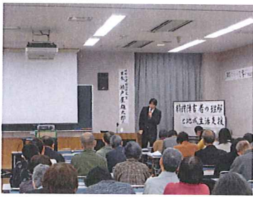
昨年度の市民講座の様子

サービス提供時間・曜日 午前9時～午後5時、 月曜日～金曜日(但し国民の祝日、 12/29～1/3まで除く)